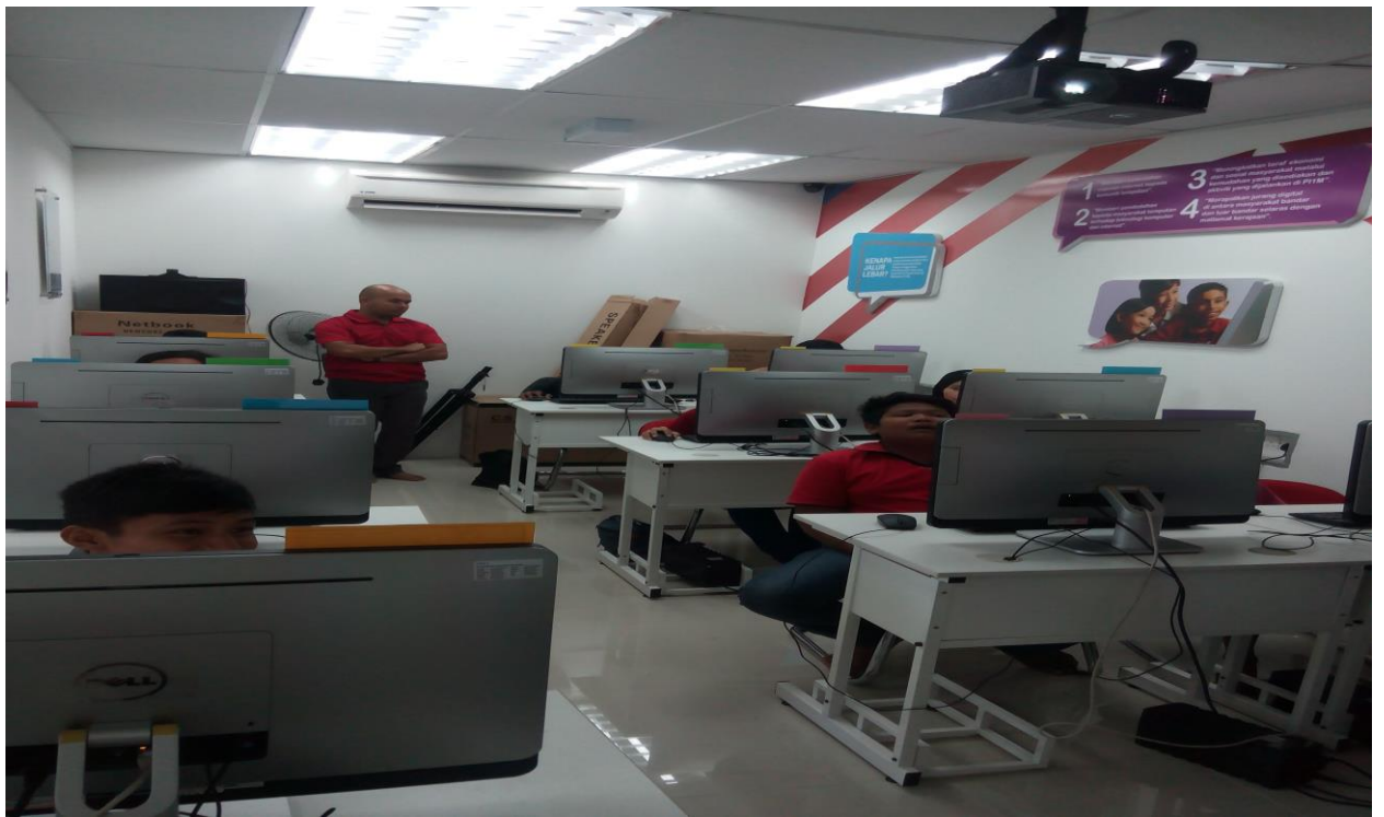
Caption : kelas intel