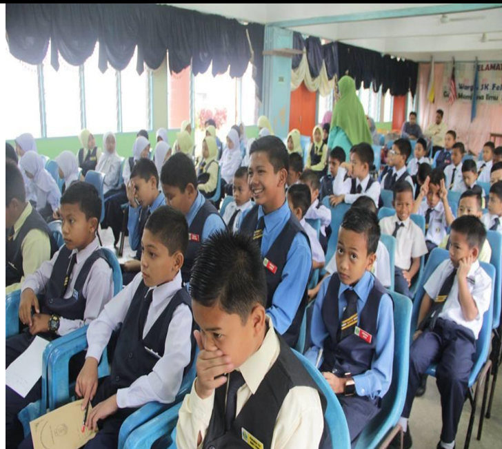
PELAJAR SEDANG MENDENGAR TAKLIMAT