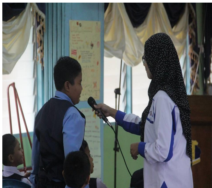
SESI SOAL JAWAB